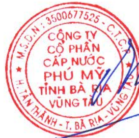
ĐINH CHÍ ĐỨC